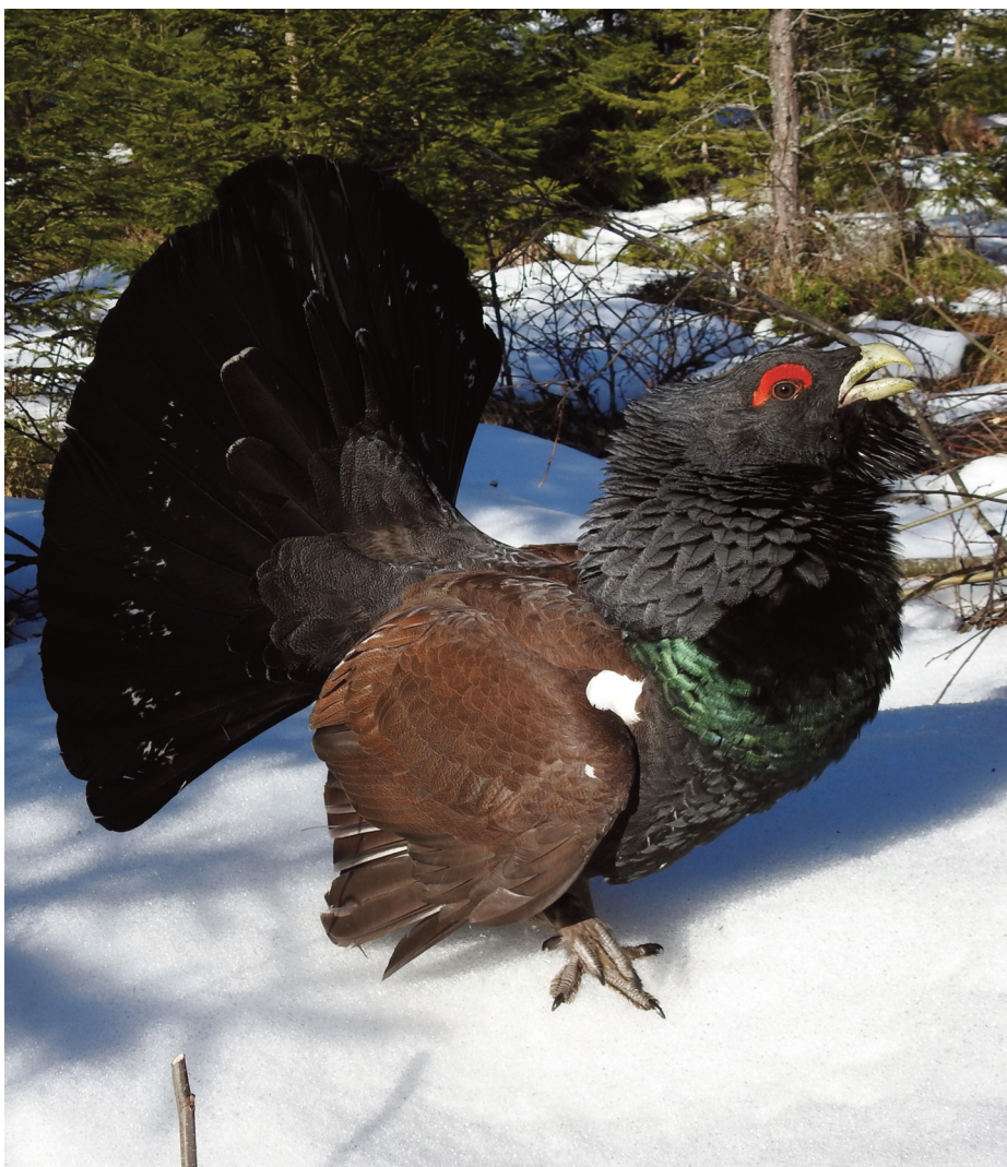
Den spiegelna tjädertuppen söder om Fada i Nyköping våren 2018

Besök Tärnans hemsida tarnan.eu där får du veta mer om vad som händer i vårt område.