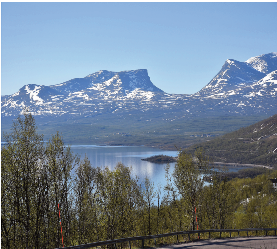
Torne träsk med Lapporten